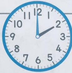
こうえん 公園につく