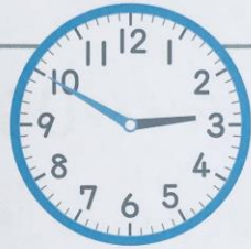
サッカーをはじめる