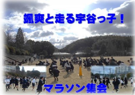
颯爽と走る宇谷っ子！

1月15日(月)～26日(金)まで、宇谷小学校ではマラソン集会が行われました。爽やかに風をきって走る宇谷っ子。2月半ば頃までにグラウンド100周することをめざして取り組んでいます。音楽に合わせてみんなで走ることで、苦手意識を持っている子ども達も自分のペースで走ることができていました。コロナ禍で落ちてしまった持久力をじわじわと身に付けている子ども達です。記録会は、各学年で開催する予定にしています。