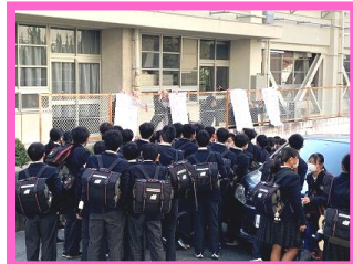
入学式のクラス発表、2・3年生のクラス発表の様子