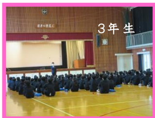
～学年集会の様子 どの学年も聴く姿勢が光ります～