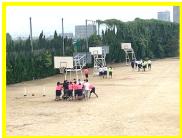
バスケットゴールを移動