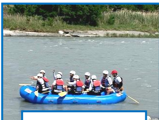
2日目 ラフティング