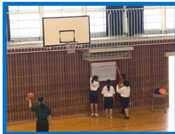
掲示物も貼ります