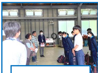
2日目 民泊先入村式