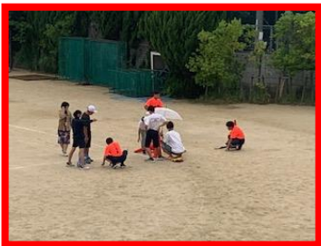
50m 走用にラインを引く準備