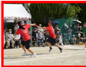
最高学年 44 期生たち