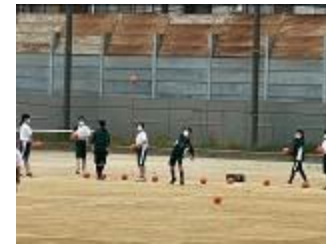
ハンドボール投げ