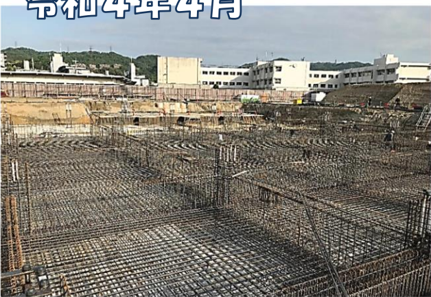
体育館棟 基礎配筋工事の様子