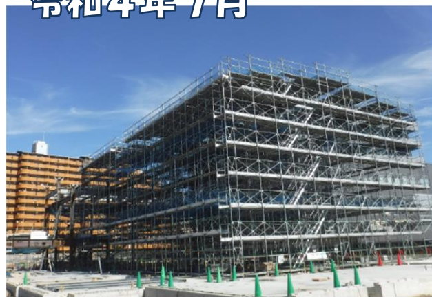
体育館棟 地上階鉄骨工事の様子

※ 工事の進捗状況は、 寝屋川市教育委員会 施設給食課のホームページ 「 第四中学校区小中一貫校施設整備工事 進捗状況 」に随時、掲載されています。