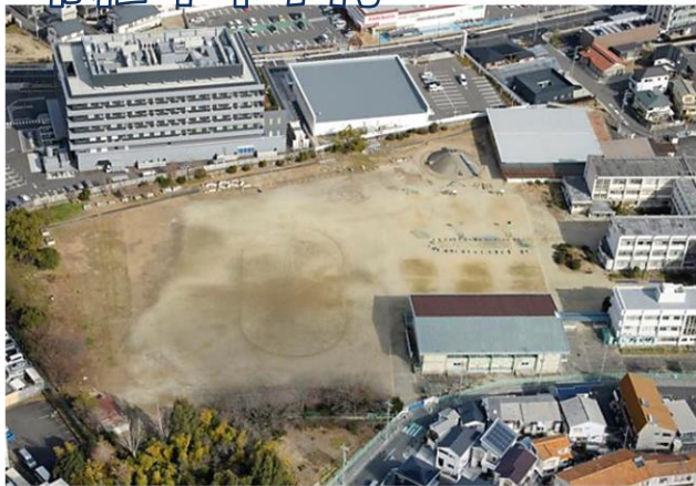
工事着工前の様子