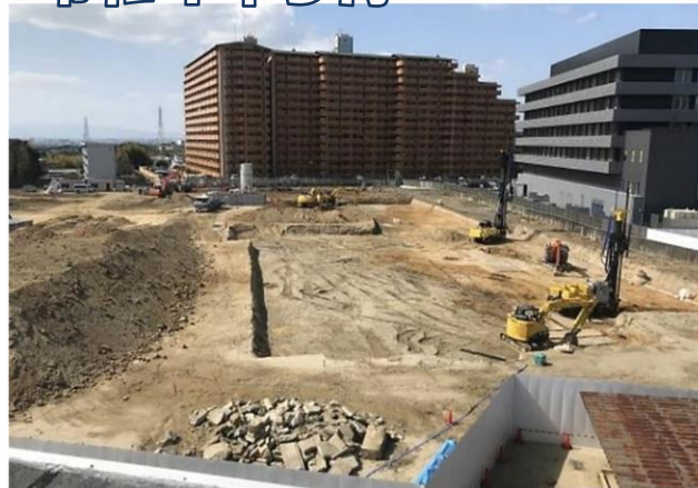
地盤改良工事の様子