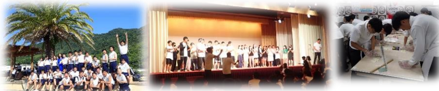
天気に恵まれました

学年で『自立・規律・飛び立つ!』と目標を掲げて時間をかけて準備をしてきた大切な行事です。出発式では「学年一丸となって、この旅行を一生の思い出に残る素晴らしいものにしよう!」と実行委員が呼びかけ、その言葉通りに53期生の絆や団結力を発揮する行事となりました。最終日は四国水族館見学とうどん作り体験です。軽快な音楽がかかると全員がノリノリで歌と掛け声をかけながらこしのあるうどんを打ち上げました。3日間の全行程を無事に終えて、多くの思い出を胸に帰校しました。