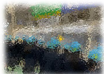
関西リサイクルシステムズ

職場体験の代わりに、職場見学にいきました。グループに分かれて各事業所に出向き、日常生活で使用している物がどのようにして作られているのかを見て、聴いて学ぶ貴重な体験となりました。