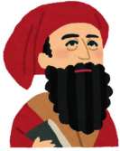
↑「東方見聞録」 書いた人

すべての高校では、1年間勉強を続け、テストで基準以上の点が取れた授業を「1単位」という言い方で数えます。西寝屋川高校などでは1年生のうちに25単位程度取れると2年生に進級できます。取れなければ後輩と共に1年生をもう一度やり直します(これを留年という)。ところが単位制高校は1年生で何単位取ろうが関係なく、3年間で74単位取れば卒業となります。つまり1年生や2年生で留年はありません。3年間で74単位取れなかった人は4年目に取れば卒業となります。「〇年生」というしくみはなく、クラスも形だけ、授業は選択科目が中心なので時間割は一人一人ちがいます。1・2年目にたっぷり単位を取っておけば、3年目は週休3日ということもできます。府立市岡高 府立槻の木高が単位制高校の例です。