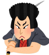
安土桃山の大泥棒 釜ゆでの刑