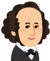
↑音楽家 真夏の夜の夢

・小論文入試の受験には、3年2学期末での9教科評定計36以上かつ数理英技計18以上という制限があります。評定計36は各教科平均4ですね。また小論文の昨年度の題は、「あなたが興味関心のある科学技術の中で、「共生」の視点で社会に貢献できるものについて述べよ」という題で、50分間で600字の小論文が出題されました。また1グループ5人ごとの 集団面接 もあります。