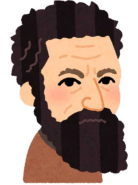
芸術家だよ ダビデ像 最後の審判

・ 選択授業が、「系列」グループ 「フィールド」グループ 「自由選択」グループの3種類に分かれています。